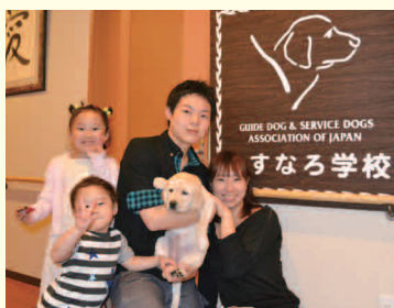
社員家族によるパピー・ウォーカーボランティア

障がい者の社会参加をサポートするために、公益財団法人日本補助犬協会の活動を支援しています。優秀な補助犬を育てるために、愛情を持って仔犬を育てるパピー・ウォーカーを社員から募ったり、子どもたちを対象に「ほじょけんの授業」と題した情操教育を行ったりしています。補助犬育成支援を通して、子どもたちに他人をいたわる気持ちや補助犬の必要性、生命の大切さを学べる機会となるよう力を入れています。