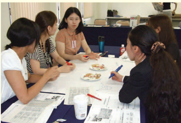
女性活用に向けた合同研修

企業の成長には、社員同士が性別や国籍、年齢、障がいの有無といった多様性(ダイバーシティ)を認め合いながら能力を発揮していくことが重要です。とりわけ、女性活用に向けた合同研修や異業種交流会の実施、社内誌等での紹介などにより互いに刺激を受けながら、切磋琢磨して自己成長を遂げようとしています。