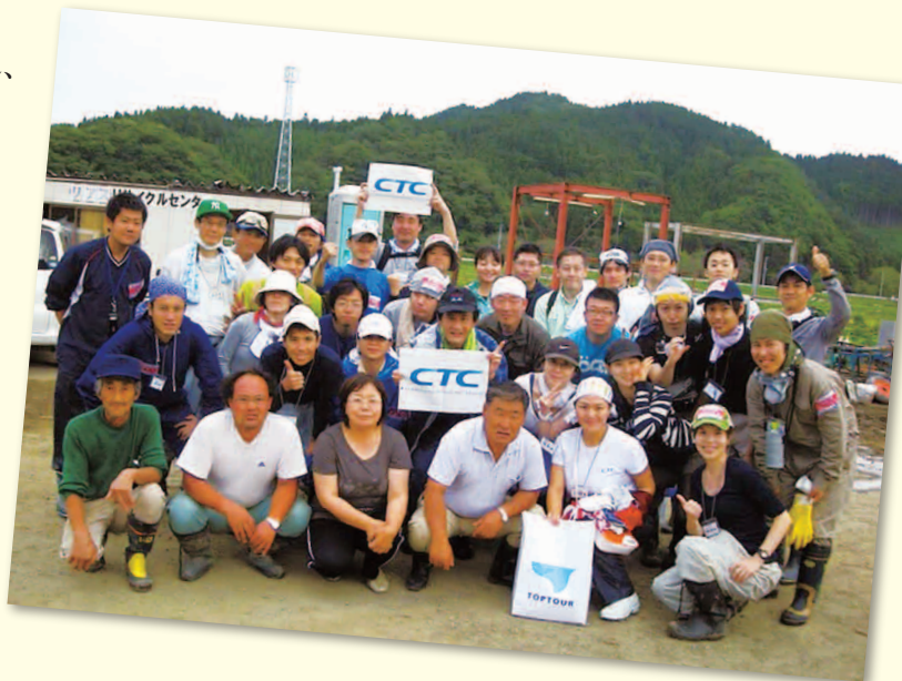
被災地ボランティアに参加したCTCグループ社員