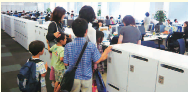
社員家族向けオフィスツアー

また、社員やその家族とのコミュニケーションを充実させる取り組みの一環として、社員家族向けのオフィスツアーを実施しており、2010年度は31名の家族が参加し、社員が誇りを持って仕事をしている姿を理解してもらうよい機会となりました。