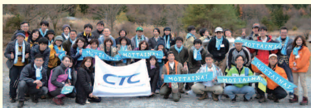
「MOTTAINAI 企業対抗! 富士山ゴミ拾い大会」に参加したCTCグループ社員

CTC社内では毎年人気の活動となった本活動は、今年で4回目。2010年度も定員を超える申し込みがあり、44名が参加しました。富士山麓に不法に捨てられたゴミを拾い、自然や森の小動物を大切にしようという気持ちから始まった本活動に賛同する社員が年々増えています。同じ志の仲間が増えていることに感謝しながら、この輪をつなげていきたいと思えます。