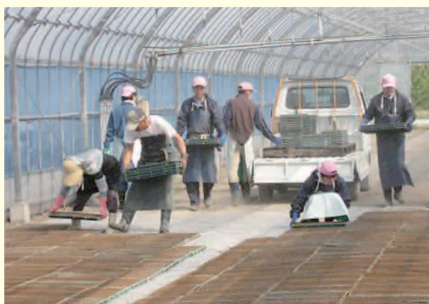
ひなり社員による農作業の請負業務

設立後は、現地の連携農園と協働して、社内給茶機用茶葉や食堂向け炊飯米などの供給拡大を図るとともに、新たに16名の障がい者を雇用し、法定雇用率1.8%を上回る水準に到達しました。今後も、現場での指導・教育を重ねながら、新たな就業機会創出に向けて努めていきます。