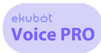
「ekubot Voice PRO」ロゴマーク

本ソリューションにより、例えば、幅広い層からの電話での問合せが主となる通信業界における本人確認・契約内容の照会や、メーカーにおける製品不具合箇所の状況確認といった業務において、音声による問合せ対応の自動化を実現できます。なお、ボイスボットにて対応しきれない問い合わせについては、それまでのやり取りをテキストで保持した状態で、スムーズに有人対応に切り替えることが可能です。