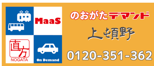
図3-2 畑/永満寺地域車体ステッカー