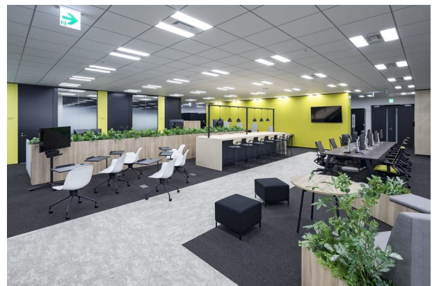
執務フロア:虹や光を構成する7色を各階のテーマカラーとして設定