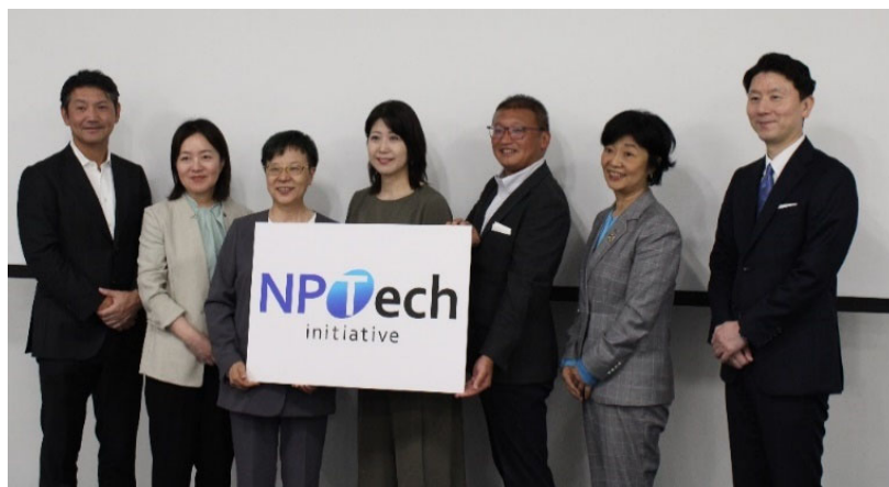
7/23(火)に開催されたNPTEch イニシアティブ 2024年度説明会の様子

社会貢献活動の中で、社会課題を理解する実践の場を増やしていくこと、それによりビジネスと社会課題をつなげていく人材を増やすことを主要テーマとしており、それがNPOの支援や会社の成長につながると思え、NPTEch イニシアティブへの参画を決めました。