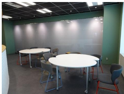
「ラコベル®プリュム®」を使用したワーキングスペース