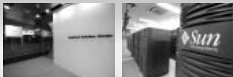
構築力で“より早く、より強く、最適に”を実現。 CTCの検証センター Technical Solution Center