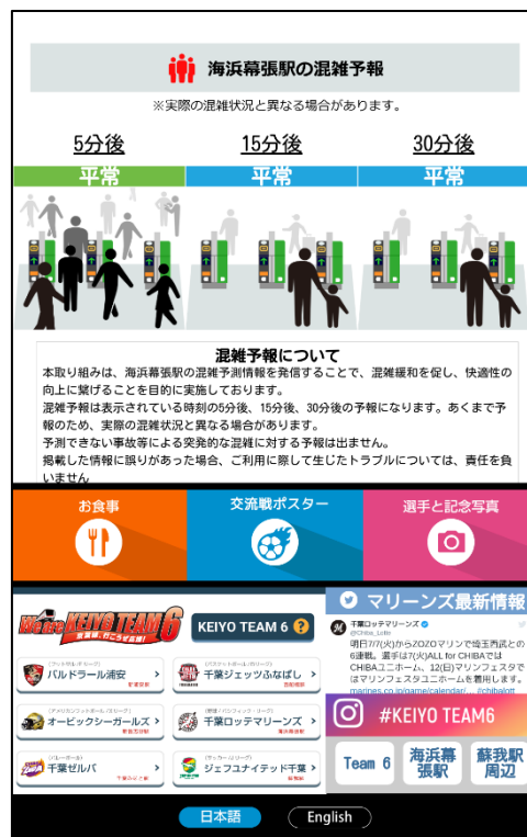
サイネージの画面